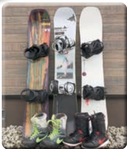
愛用しているボードとブーツ

(注1) バックカントリーとは、人工的に整備されたスキー場ではなく、自然そのままの雪山を滑ること