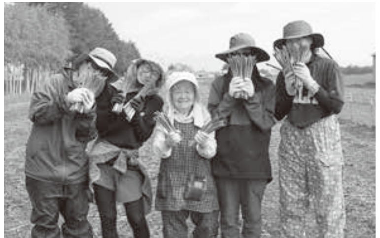
でめんさんの方々には感謝の気持ちで一杯です。いつもありがとうございます！

農業は体力を使う仕事なので、子育て世帯は精神的にも肉体的にも大変な時期がきつとあると思います。『辛い農作業』ではなく、『楽しい農作業』と考えるように毎日の作業が出来たらいいなと思います。 ○これからの目標 子供達にはまだまだ手はかかりますが、少しずつ子育てや仕事にも時間に余裕が作れるようになってきたので、もっと趣味を増やし、楽しんでいきたいです。 ○家族の目標 家族みんなでUSJへ行き、思いっきり遊んで食べ歩きやショッピング等の旅行がしたいです。