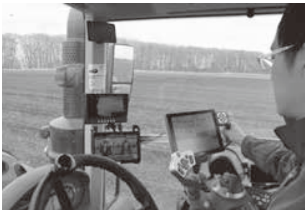
GPSを活用し、圃場の整地作業中

自分自身コンピュータ系が好きなので、人が作業しなくても管理できるような超ハイテク酪農家を実現したいです。