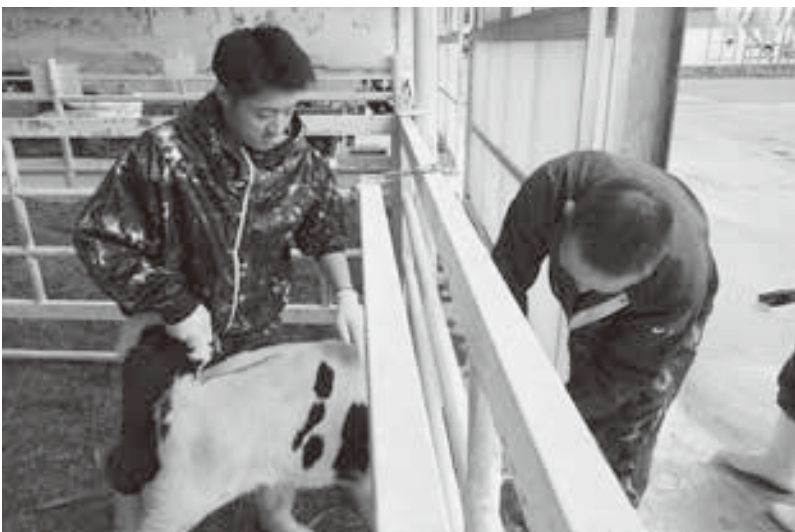
導入牛へのタグや耳標の装着作業

5月7日〜24日までの日程でホクレン新人職員の農協実習が行われました。当JAでは3名の新人職員を受け入れし、鹿追町農業の概要説明や当JAが取り組む事業概要の研修、Aコープ・スタンド・野菜施設業務といった現場部門での作業体験を行いました。また、農業者の生活や日常業務の理解を深めるため生産者宅での農業実習も行われました。