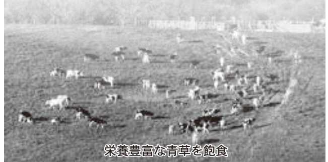
栄養豊富な青草を飽食

乳牛育成牧場では、集約放牧により安定的に青草を摂取させ増体量の向上に努め、また、飼養管理の徹底により、乳牛の疾病及び事故防止に努め、生産性が高く健康な乳牛の育成に努めて参ります。