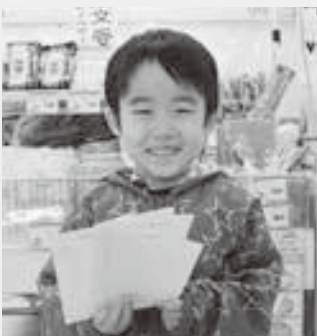
〈今月の抽選者は私です〉